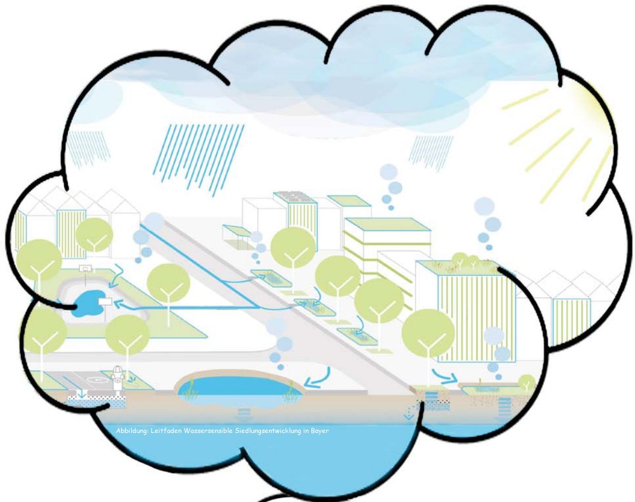
Abbildung: Leitfaden Wassersensible Siedlungsentwicklung in Bayer

...aber nicht mit Water Sensitive Urban Design! Versickerung | Rückhalt | Speicherung | Verdunstung